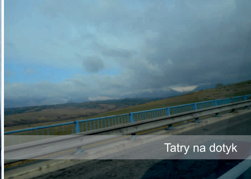
Tatry na dotyk