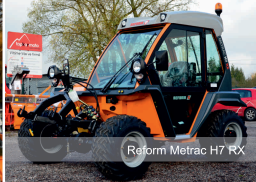
Reform Metrac H7 RX