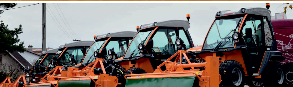
Pred odjazdom z Dlouhoňovic