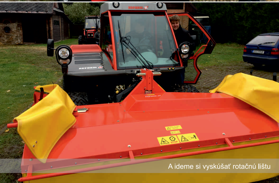
A ideme si vyskúšať rotačnú lištu