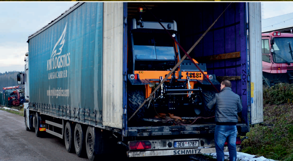
Kľúče mám, papiere mám, tak to bude asi všetko