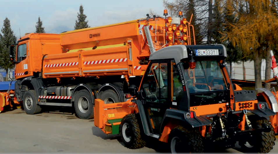
Sú to vždy veľké manévry