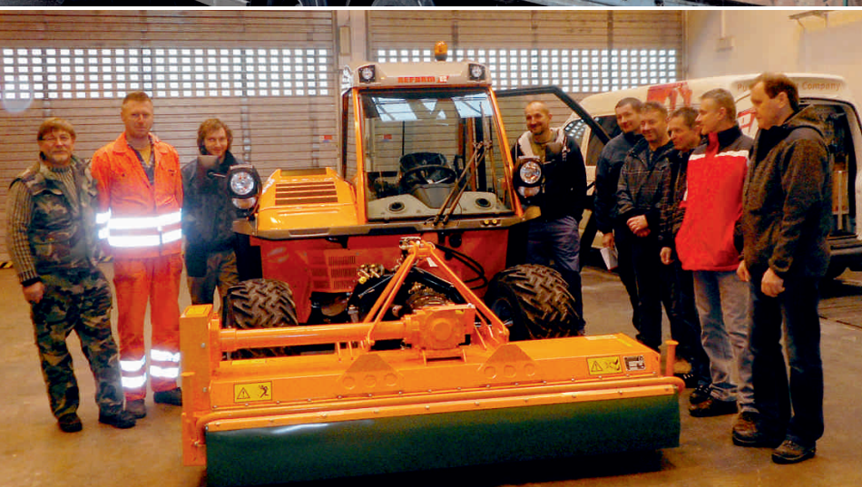
Spoločná fotka a úsmev pre médiá