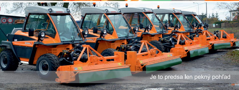
Je to predsa len pekný pohľad