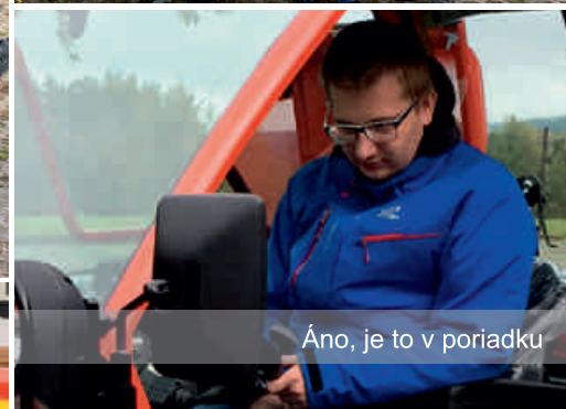
Áno, je to v poriadku