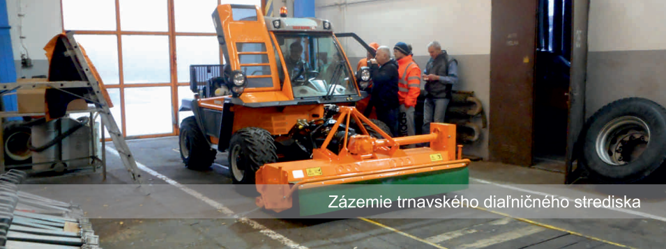
Zázemie trnavského diaľničného strediska