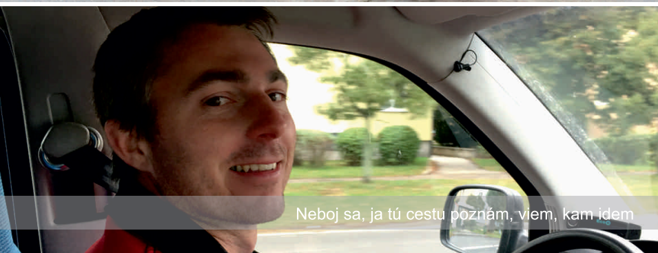
Neboj sa, ja tú cestu poznám, viem, kam idem