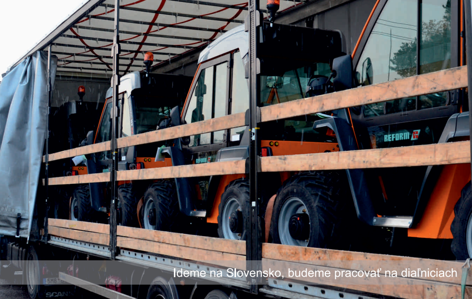
Ideme na Slovensko, budeme pracovať na diaľniciach

V ten deň nás ešte čakal presun do Martina. Je to asi sto kilometrov, teda hodina a pol jazdy. Zvládli sme to bez prietahov. V ten deň sme sa však už do ďalšieho odovzdávania nepúšťali. Iba sme stroj zložili z kamióna. Potom sme šli do hotela, kde sme si dali večeru, pivo a dobrú noc. Boli sme ťahaní ako mačatá. Mám pocit, že som zaspal skôr, než som si pretiahol perinu cez ramená.