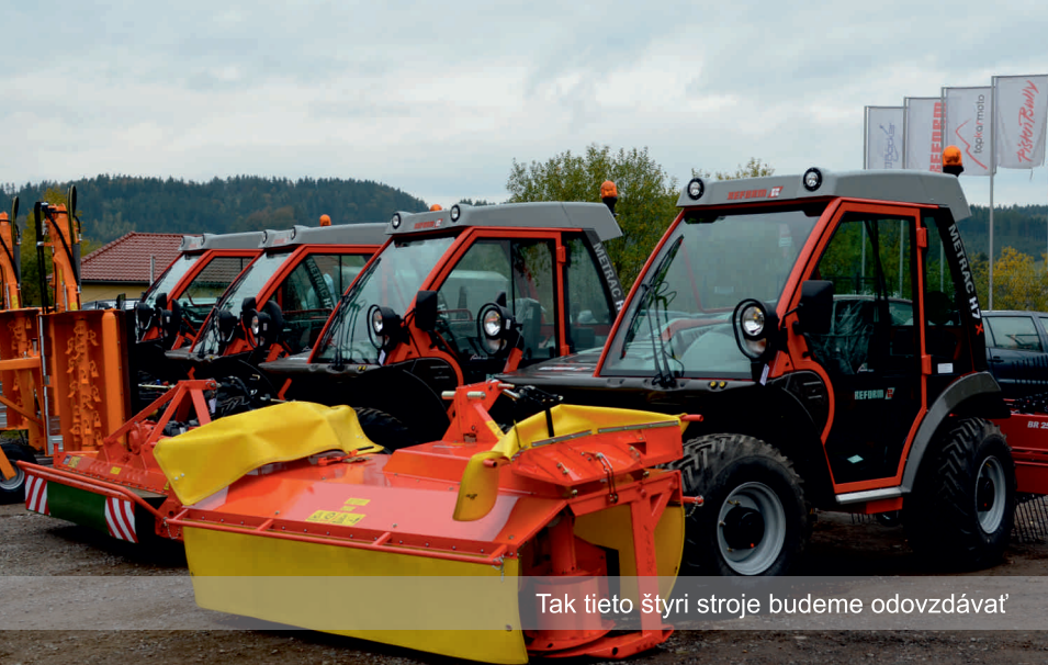
Tak tieto štyri stroje budeme odovzdávať