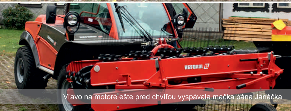
Vľavo na motore ešte pred chvíľou vospávala mačka pána Janáčka