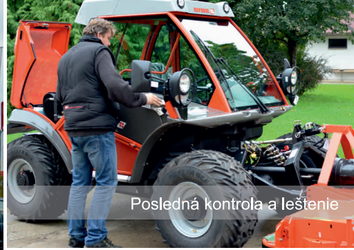
Posledná kontrola a leštenie