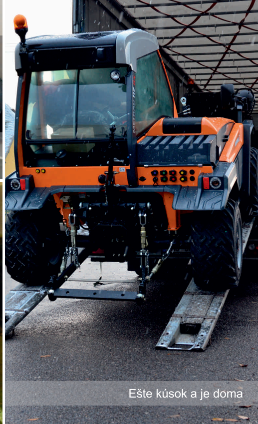
Ešte kúsok a je doma