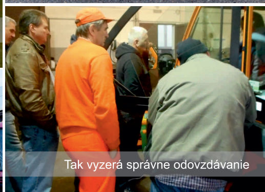
Tak vyzerá správne odovzdávanie

Máme to pre túto chvíľu za sebou. Odovzdali sme päť nových strojov. Ďalšie odovzdávanie nás čaká ešte tohto roku v decembri. To však budeme mať blízko. Bude to v Bratislave.