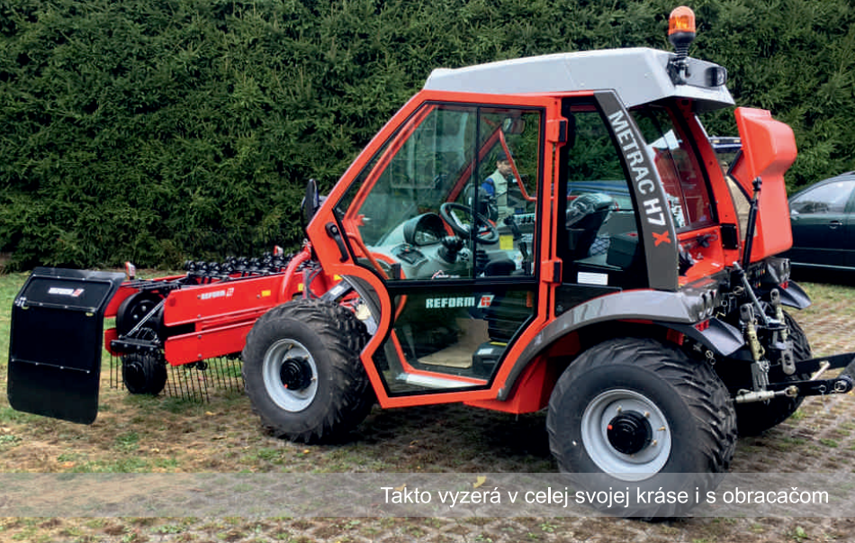
Takto vyzerá v celej svojej kráse i s obracačom