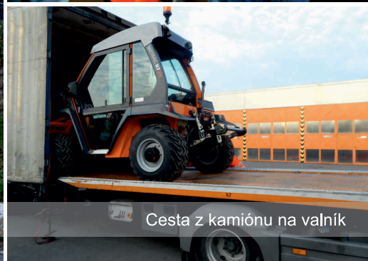
Cesta z kamiónu na valník