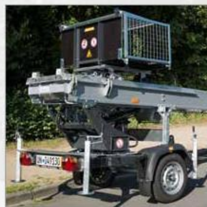
Kompaktní podvozek s integrovaným osvětlením