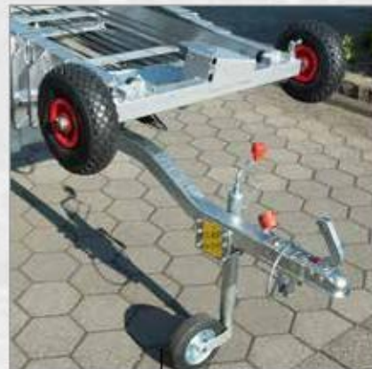
Oj se závěsem na kouli a opěrnou nohou s kolečkem namontována na nosnou kolejnici

Účinný stavební výtah Simply disponuje atributy dobrý, levný a výkonný! jako žádný jiný zikmý výtah a vyznačuje se svojí robustní technologií a také jednoduchým ovládáním. Extrémně malé místo pro postavení a jednoduchá stavba dělají ze Simply jedinečný výtah pro každé použití.