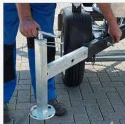
Výškový klikový podpěráč