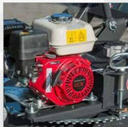
Pohon elektromotorem 230 V nebo benzinovým motorem HONDA